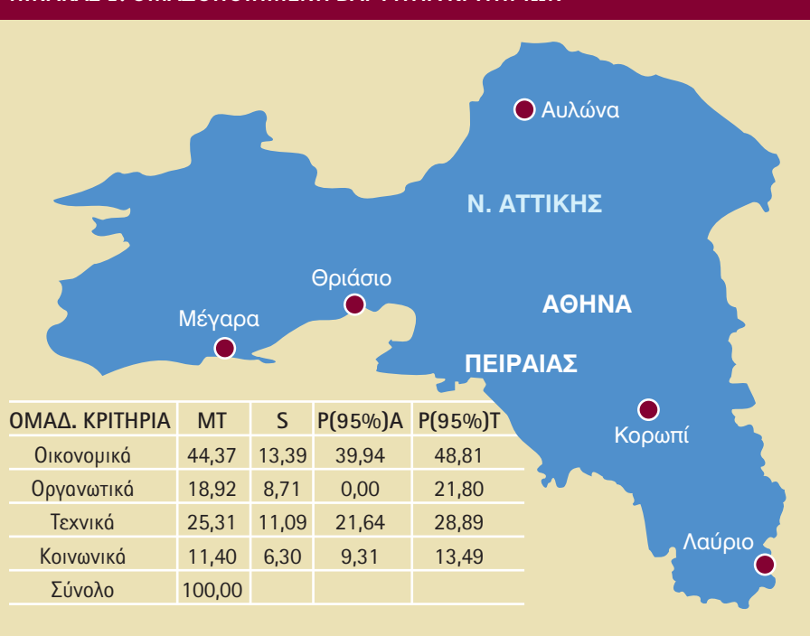
ΠΙΝΑΚΑΣ 2. ΣΥΝΟΠΤΙΚΟΣ ΠΙΝΑΚΑΣ ΓΕΝΙΚΗΣ ΒΑΘΜΟΛΟΓΙΑΣ